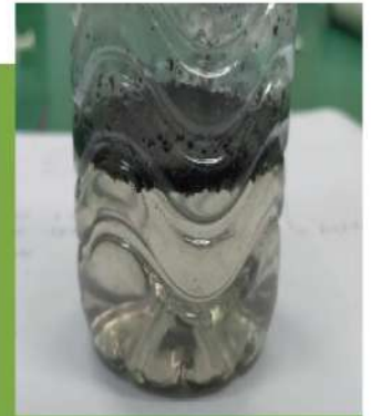
UV塗料 / UV Paint