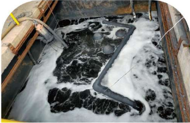
Paint Sludge Collection Tank