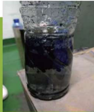
ウレタン塗料 / Urethane Paint