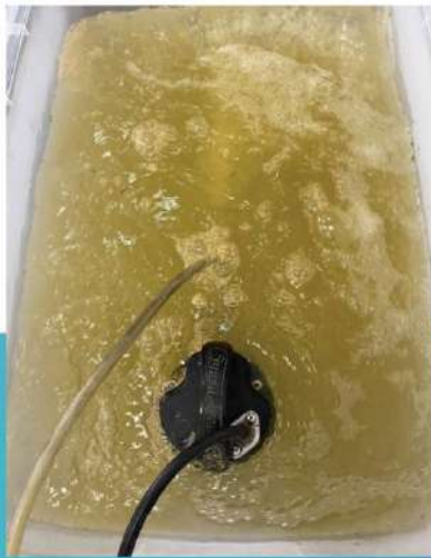
食品雑排水 Raw Food Industry Wastewater